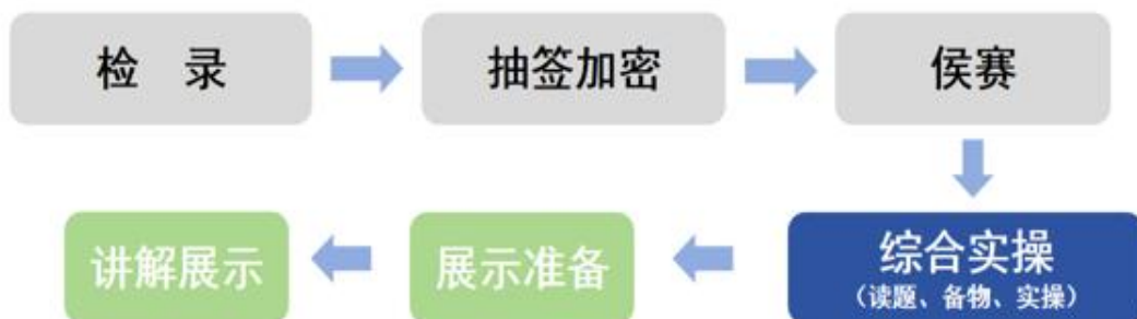
图2 老年护理与保健选手竞赛流程图

各参赛选手团队完成试题读取后，持赛题案例依次进入各工作场景的实操模块区，最后进入应考工作场景的讲解展示模块区。